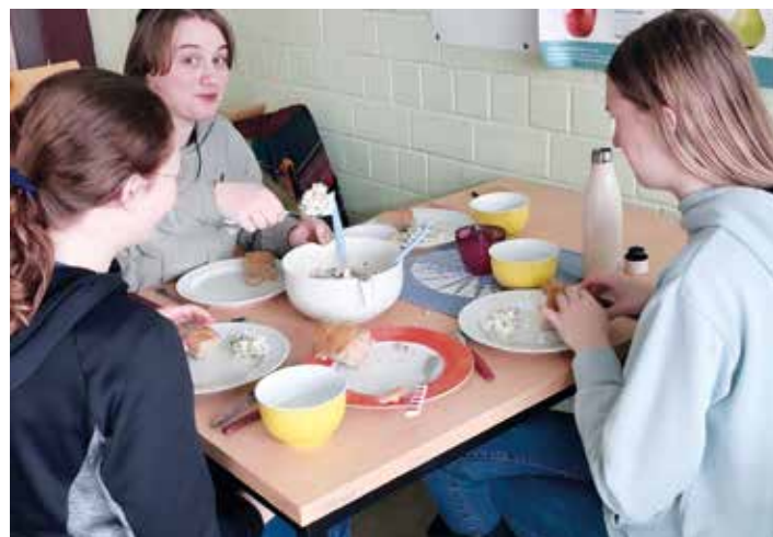
Großen Spaß mit antiker Küche hatten unsere Latein-Schülerinnen und Schüler der Jahrgänge 9 und 10.