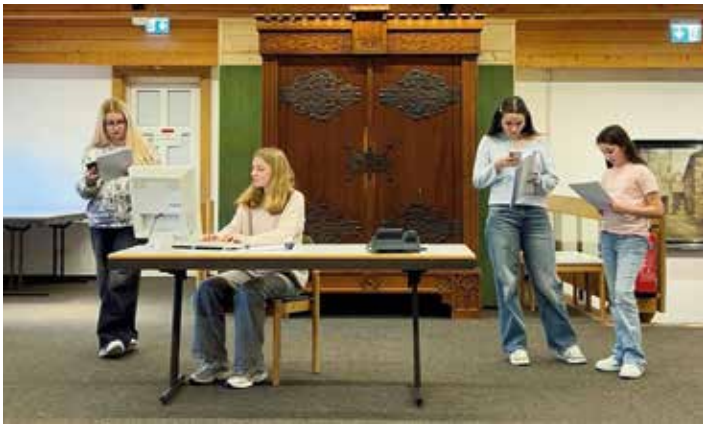
Probenfoto: Theatergruppe „Peter von Orb“